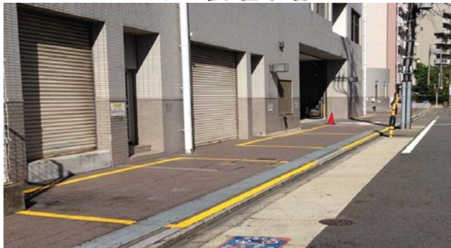
<ヤマナカ裏 駐車場>

契約駐車場満車の場合は名鉄協商コインパーキングをご利用ください。その際は必ず事前に精算機にて駐車証明書を発行し、受付までお持ち下さい。時間に応じたサービス券をお渡しいたします。